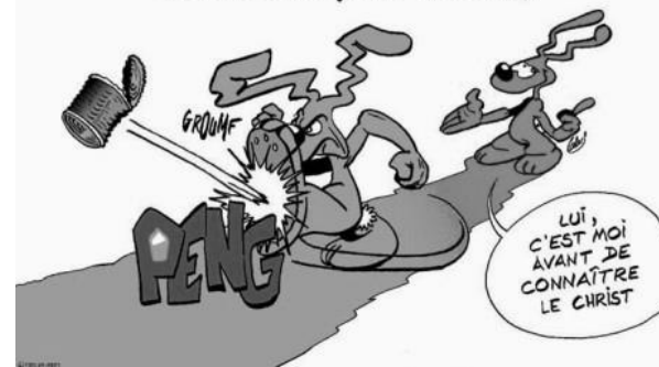
Dessin librement inspiré de la 2 ème lecture du 12 ème dimanche du Temps ordinaire

SI DONC QUELQU'UN EST EN JÉSUS-CHRIST, C'EST UNE CREATURE NOUVELLE LE MONDE ANCIEN S'EN EST ALLÉ, UN MONDE NOUVEAU EST DÉJÀ NÉ (2Co 5,17)