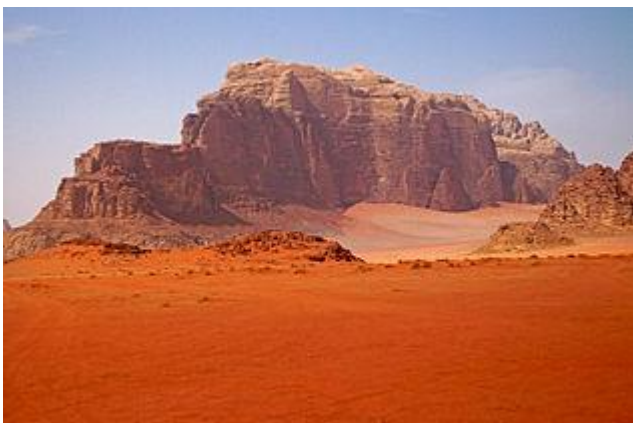
Désert de Jordanie